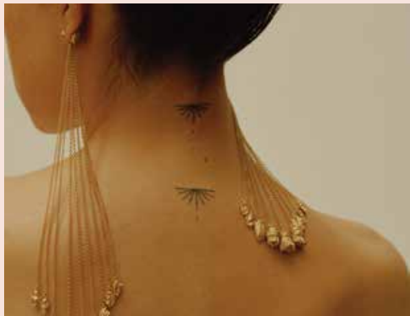
策展人：Stanislava Pinchuk和Zaiba Khan。