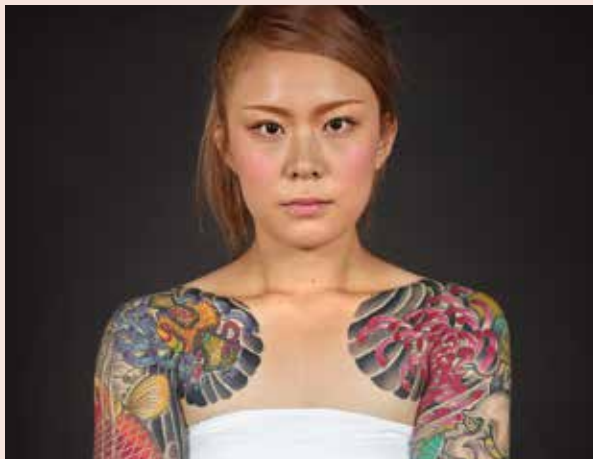
纹身师Yokohama Horiken的作品。

由日裔美国人国家博物馆筹划，获Flying Fish Exhibits策展公司支持全球巡展。